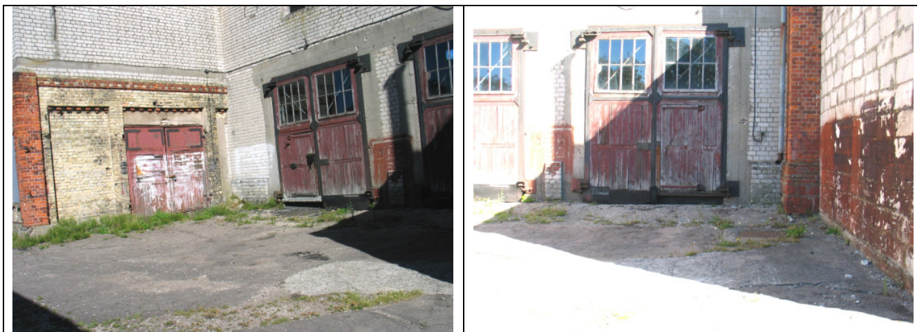
1.4.39. Vēsturiskās ēkas pārbūvētas tām izbūvētas vairākas piebūves.