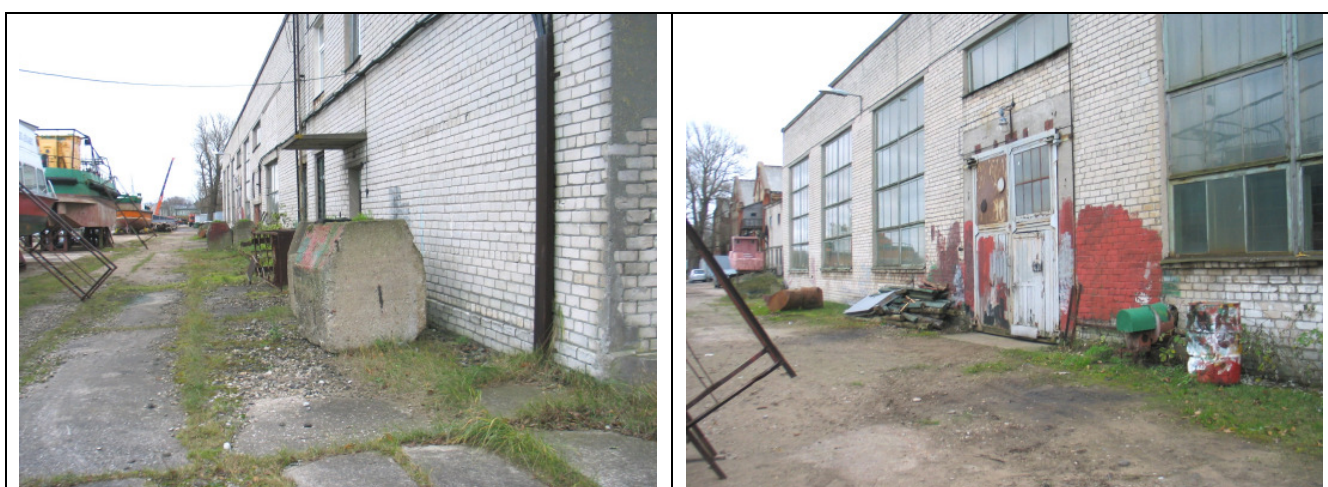
1.4.37. Teritorijai apgaismojums nav izbūvēts, dažviet uzstādīti gaismekļi.