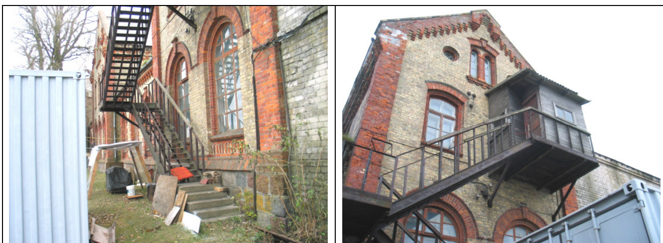
1.4.40. Pie ēkas K.Valdemāra ielā 12 ziemeļu pusē (piestātnes pusē) ir izveidotas kāpnes uz otro stāvu.