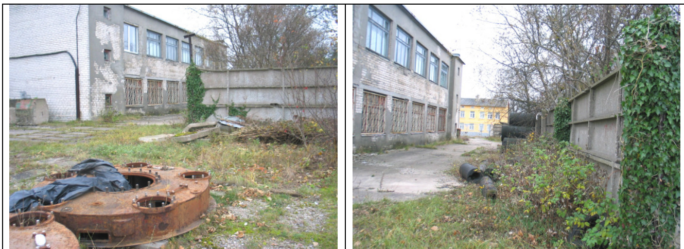
1.4.36. Paredzēts atjaunot ražošanas ēku K.Valdemāra 14.